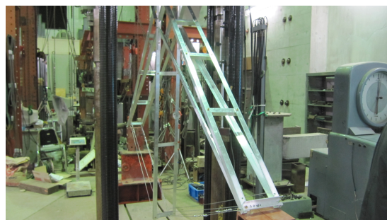
図 1: 単純梁